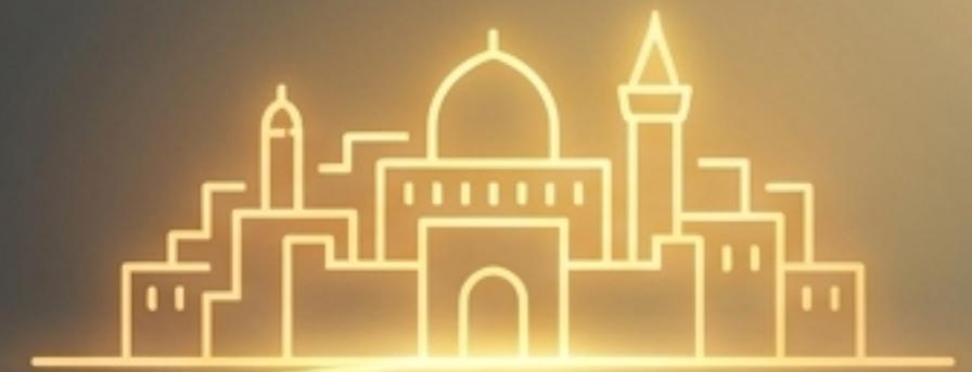
JERUSALÉN (La Vigilia)

Cuando el peso del ataque se vuelve insoportable, la tentación humana es huir a “Egipto”—retornar a la vida antigua para evadir el dolor. Es la máxima expresión de dejarse vencer por el pesar.